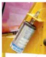
Automatický seřiditelný přimazávač