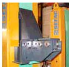
Integrované podložky (manuální nebo motorové)