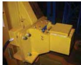
Integrované podložky (manuální nebo motorové)