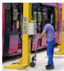
Pojezd ( manuální nebo motorový )