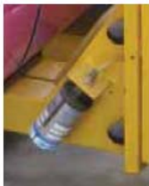
Automatický seřiditelný přimazávač